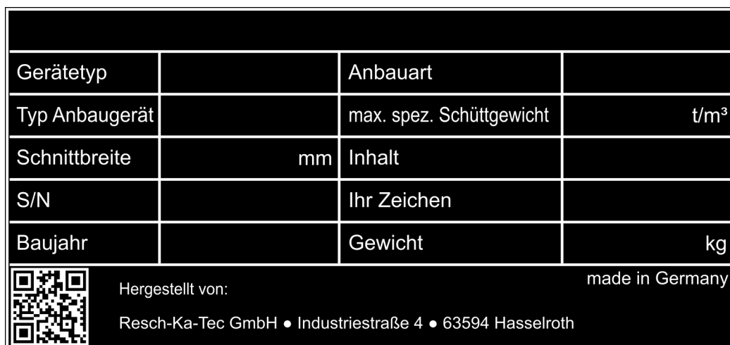
Abbildung 1. Typenschild (Muster)

Das Typenschild enthält alle produktspezifischen Informationen, die für die Montage und die Wartung des Anbaugeräts benötigt werden. Das Typenschild darf deshalb nicht entfernt werden.